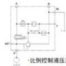
比例控制液压原理图