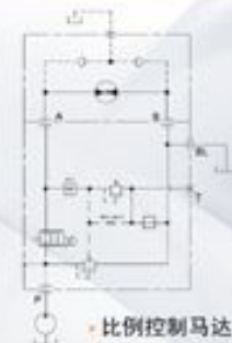
比例控制马达调速

> MOD. EC-VIS-G-G-D12EK4-M-C Alpha-numeric display with built-in PWM driver for ground speed oriented control of a hydraulic motor 数码显示器 内置GPS导航 PWM放大器控制马达调速